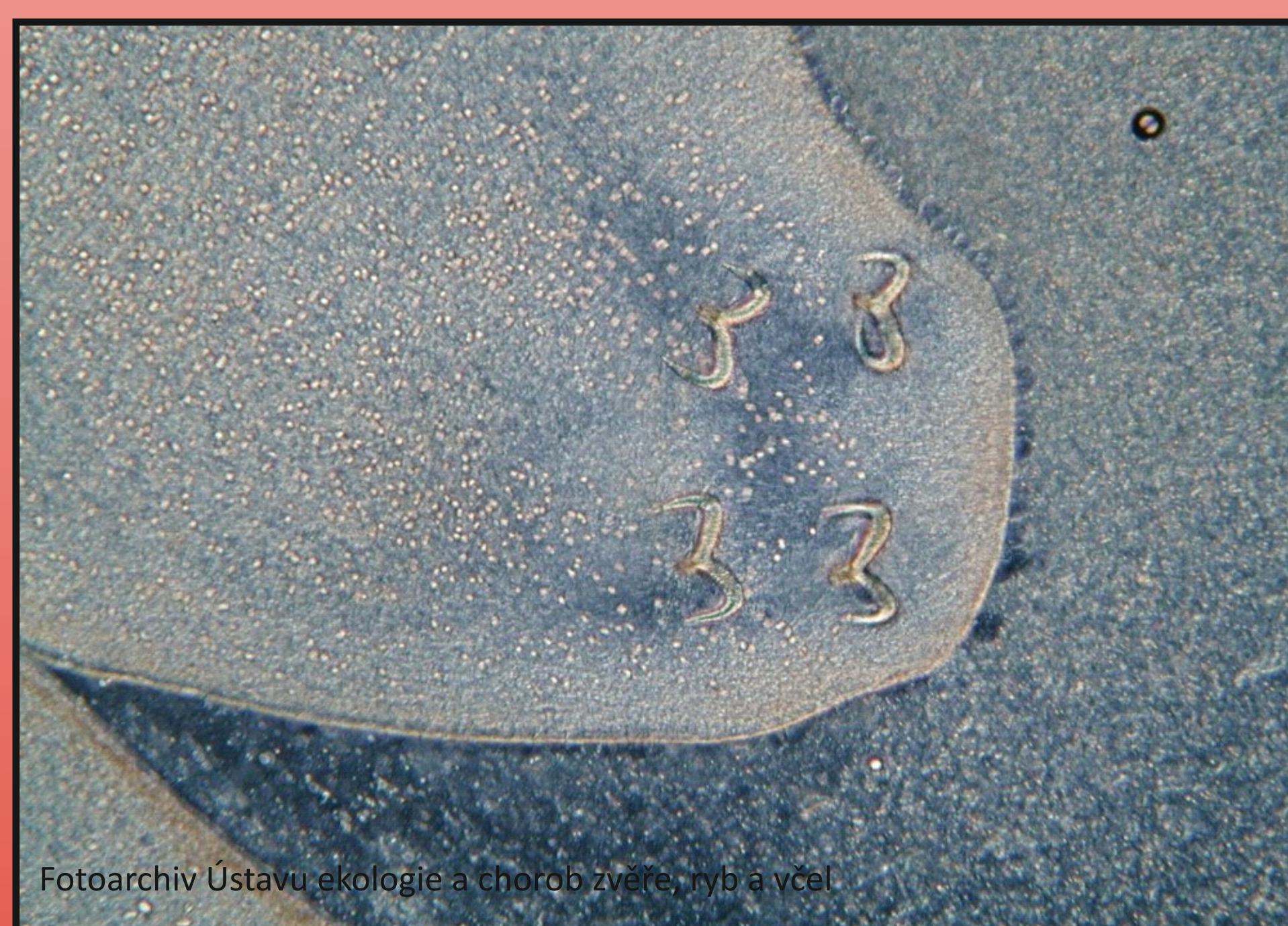
Obr. 2. Mikroskopie: T. nodulosus - skolex plerocerkoidu